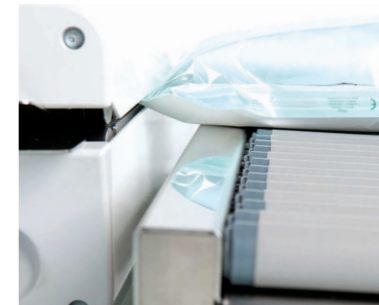
Transportador de rodillos